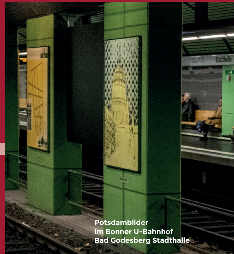
Potsdambilder im Bonner U-Bahnhof Bad Godesberg Stadthalle