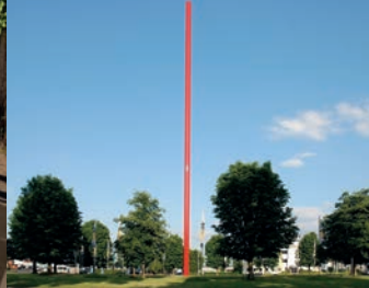
Potsdamer Platz am Bonner Verteilerkreis