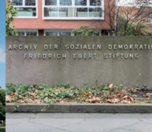
Friedrich-Ebert-Stiftung in Bonn, Godesberger Allee 149