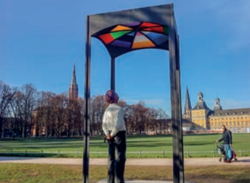
August Macke am Bonner Hofgarten