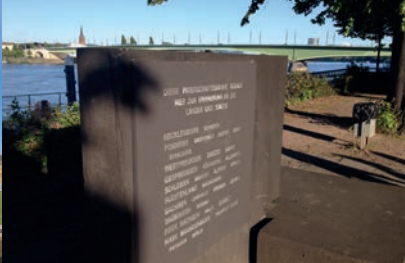
Potsdam-Patenschaftsbäume am Rheinufer