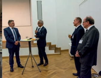
Bürgerbegegnung Bonn-Potsdam 2018: die Oberbürgermeister mit den Partner-Clubs