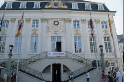
Altes Rathaus am Bonner Markt