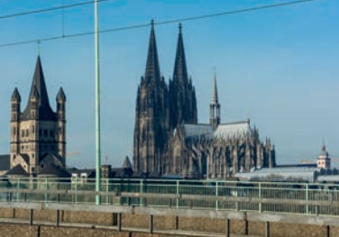
Kölner Dom zwischen romanischen Kirchen