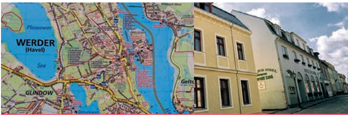
Werder mit Inselstadt