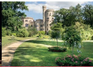
Pleasureground im Park Babelsberg