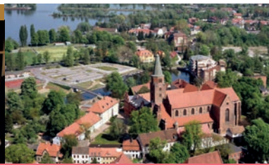
Dom zu Brandenburg