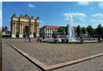
Luisenplatz mit Brandenburger Tor